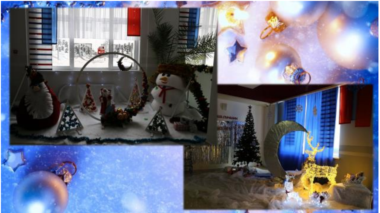
Фото новогоднего оформления победителей в номинации «Оформление фойе, актовых и спортивных залов», Гимназия №14, СОШ №42.