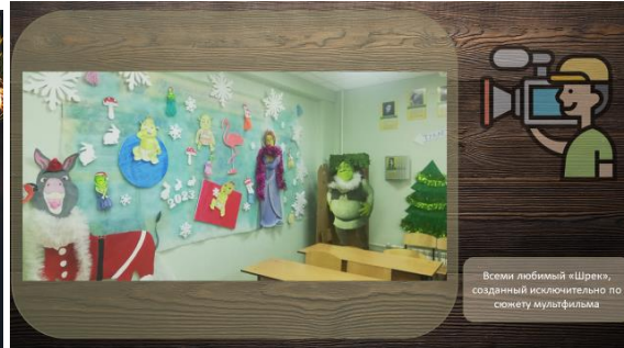
Фото новогоднего оформления победителя в номинации «Оформление учебного кабинета», Гимназия №61, Гимназия №26.