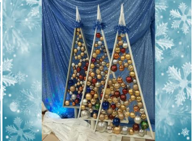
Фото новогоднего оформления в номинации «Оформление фойе, актовых и спортивных залов», ДШИ №13, ДШИ №7.