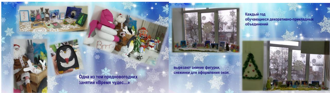
Фото новогоднего оформления в номинации «Оформление учебного кабинета», ДЮОЦ №14.

Фото новогоднего оформления победителя в номинации «Оформление учебного кабинета», Гимназия №61, Гимназия №26.